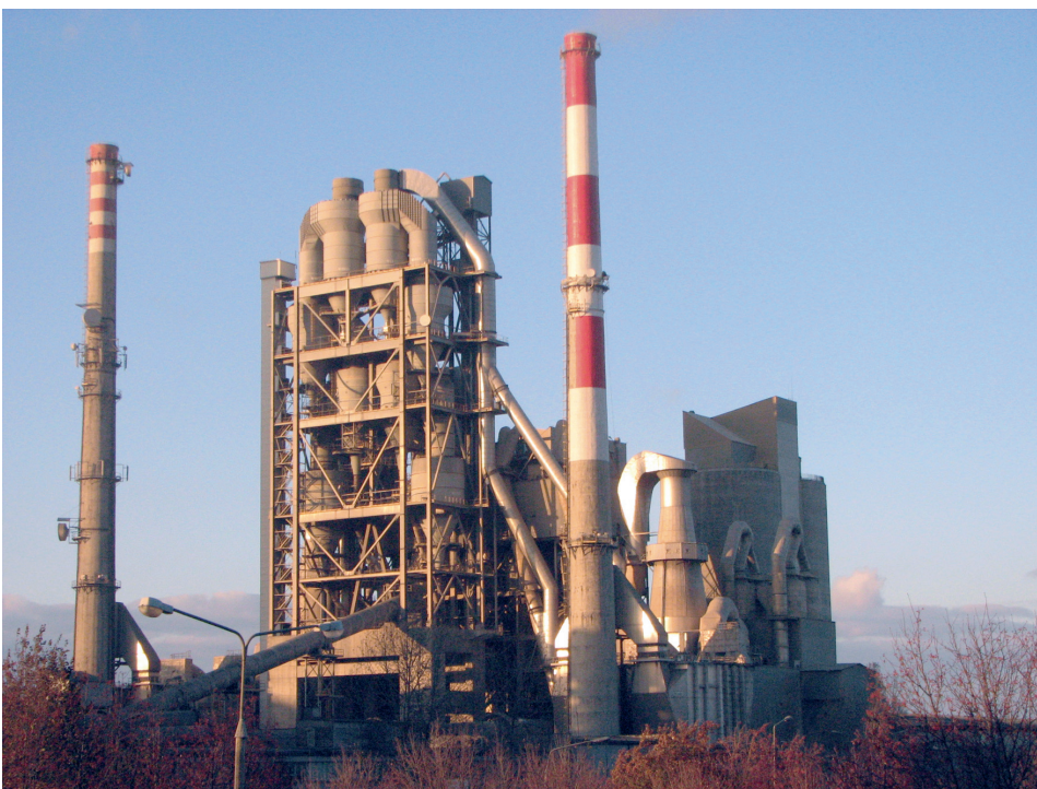
Rys. 4. Wieża wymienników cyklonowych po modernizacji