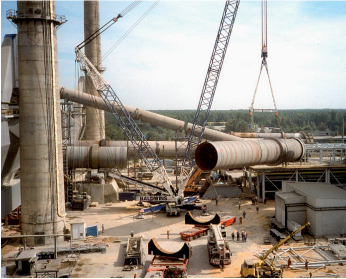
Rys. 2. Modernizacja pieca nr 1.

w dostatecznym stopniu doświadczoną kadrą nowego zakładu. Nie był to zresztą jedyny powód małej produkcji cementu w Ożarowie, bowiem w latach osiemdziesiątych wystąpił duży kryzys gospodarczy w Polsce, który odbił się ujemnie na wynikach wszystkich sektorów przemysłowych. Dopiero po roku 1985 produkcja cementu w Ożarowie zaczęła wyraźnie wzrastać, osiągając w roku 1989 bez mała jeden milion 700 tysięcy ton.